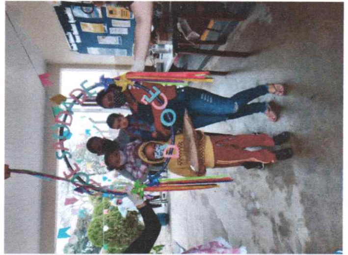
Drive Thru Julino