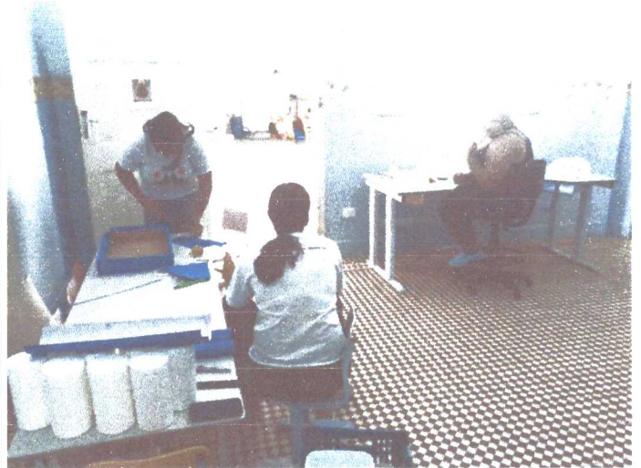
Organização e revitalização dos espaços para 2020.