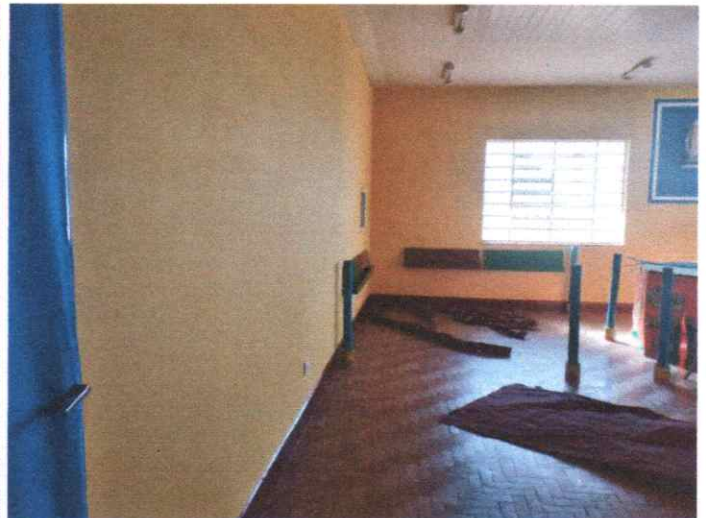
Revitalização dos espaços