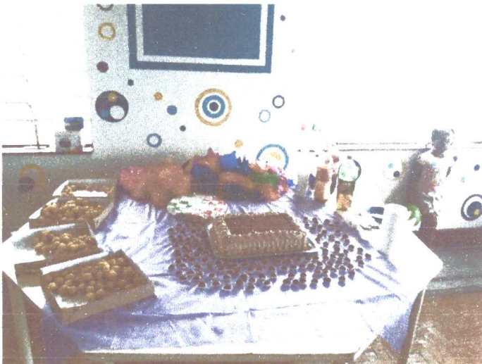
Festa de encerramento para pré II.