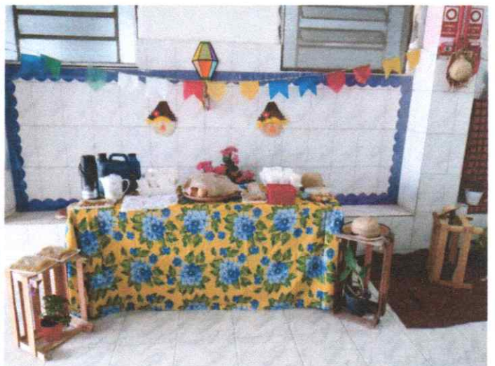
Formação com os funcionários